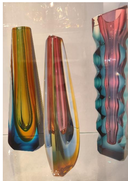
....a ukázka vystavených exponátů

Z muzea na náměstí Míru nemáme daleko do další destinace, originální a poněkud neobvyklé restaurace Hut' : v ní můžete během konzumace nabízených pochutin a nápojů skrz mohutná vnitřní okna sledovat skláře při práci v bezprostředně přiléhající dílně. Ale pozor: jen do 15 hodin! Jakkoliv je restaurace otevřená i poté, místní řemeslníci už mají „padla“.