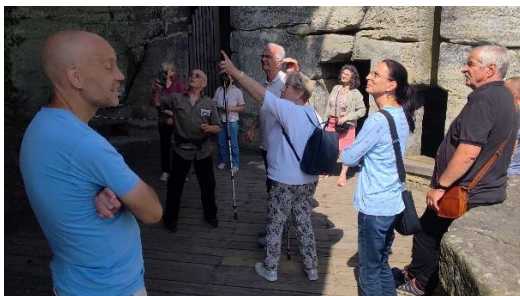
Značná část prohlídky hradu probíhá venku.