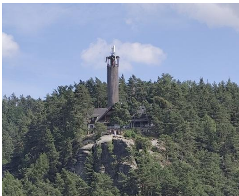
Naše poslední zastávka, restaurace... ...s rozhlednou.