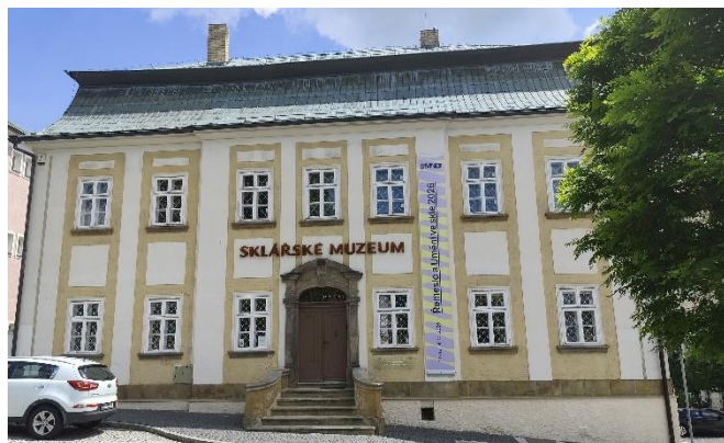
Novoborské Sklářské muzeum...

Pak již následuje plánovaná návštěva novoborského Sklářského muzea , druhé nejstaršího instituce svého druhu na světě (založeno 1893). Zde se z výkladu před samotnou prohlídkou cca 550 místních exponátů dozvídáme mnohé jak o historii muzea, tak o stylovém a technologickém vývoji sklářství na Novoborsku od 18. století až po současnost.