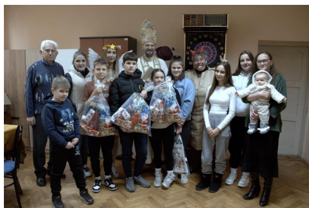
Obrázek 4: ČB Lipovlany