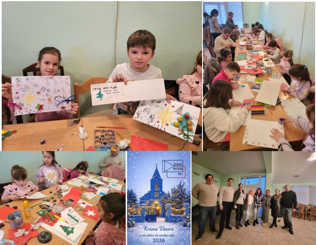
Výtvarné dílny v mateřské škole v Kruščici