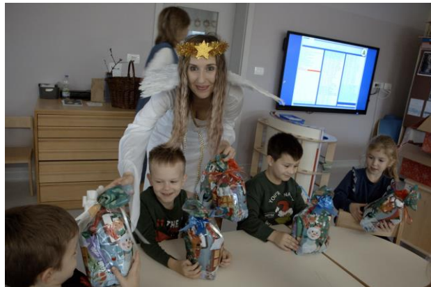
Obrázek 8: Česká mateřská škola Ferdy mravence