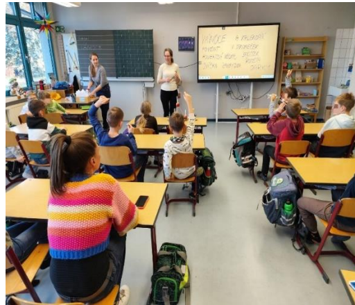
Chrósćicy 3. r.