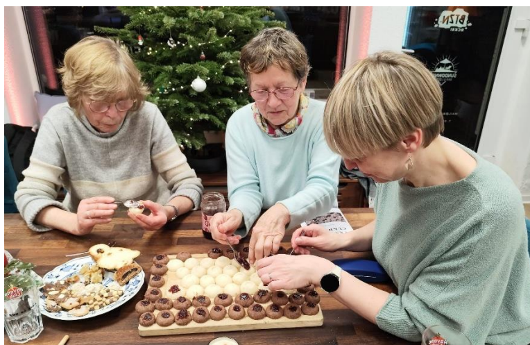
Plně soustředěné kurzistky

Rovněž dospělí vypadali stráveným večerem nadšení: když jsme se loučili a přáli si hezké svátky, zazněla několikrát otázka, zda si akci za rok zopakujeme. Za sebe říkám jednoznačné ano.