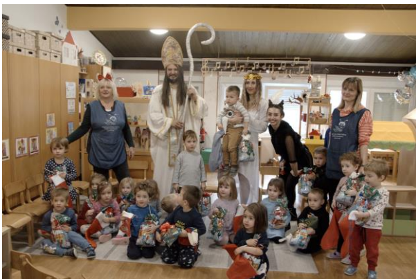
Obrázek 7: Česká mateřská škola Ferdy mravence