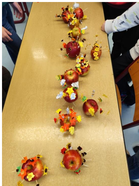
Hotová vánoční jablíčka