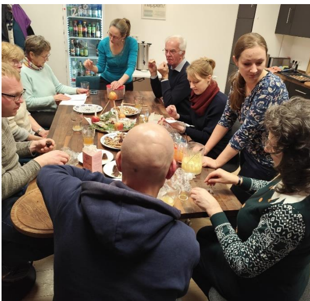
Studio B při nehudbní produkci