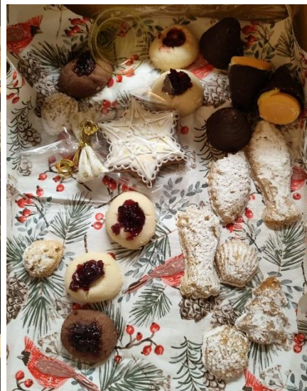
Výsluška stála za to