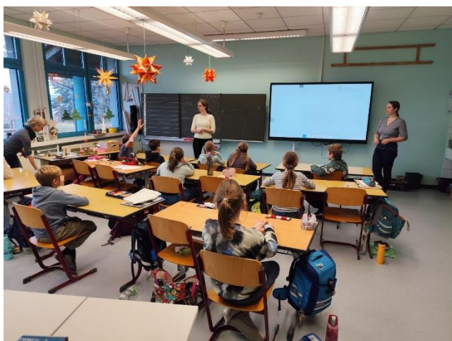
Chrósčicy 4. r.

Prvostupňové děti ze základních škol v Pančicích-Kukowě, v Chrósčicích a v Ralbicích se na návštěvu z Česka opravdu těšily (v Ralbicích si dokonce odsouhlasily účast na odpoledním kroužku češtiny, který měl mít podle školního kalendáře již vánoční pauzu) a v příslušný den se opakovaně ujišťovaly, že „ty paní“ opravdu dorazí. Dorazily a děti mohly být spokojené: dozvěděly se (resp. starší si zopakovaly), kdo a kdy v Česku nosí dárky, co o Vánocích jíme a jaké děláme cukroví. Ochutnaly vánočku a vánoční perníčky. Pak dostaly jednoduché kostýmy a rekvizity a vytvořily živý betlém. Zlatým hřebem pak vždy bylo vyrábění vánoční dekorace z jablka, hřebíčku, párátka a papírových kytiček – některé děti si pak ozdobu hrdě odnesly domů, jiné se ptaly, kdy konečně budou jablíčko moci „odstrojit“ a spořádat. V Ralbicích pak došlo i na zdobení vánočních perníčků. Čtvrtý chrósčický ročník spolu s paní učitelkou za zábavnou a podnětnou aktivitu poděkoval zpěvem vánoční lužickosrbské písničky a krásnou ručně vyráběnou papírovou hvězdou pro každého z organizátorů.