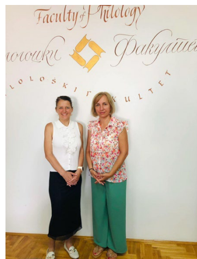
Předání certifikátů absolventům loňských kurzů pořádaných přes centrum Nirsa a návštěva Filologické fakulty Univerzity v Banja Luce