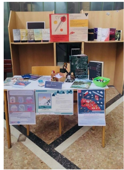
Den otevřených dveří na Filozofické fakultě Univerzity v Sarajevu