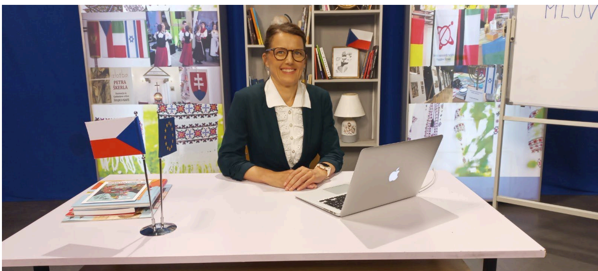
Natáčení cyklu Mluvíme česky pro RTRS