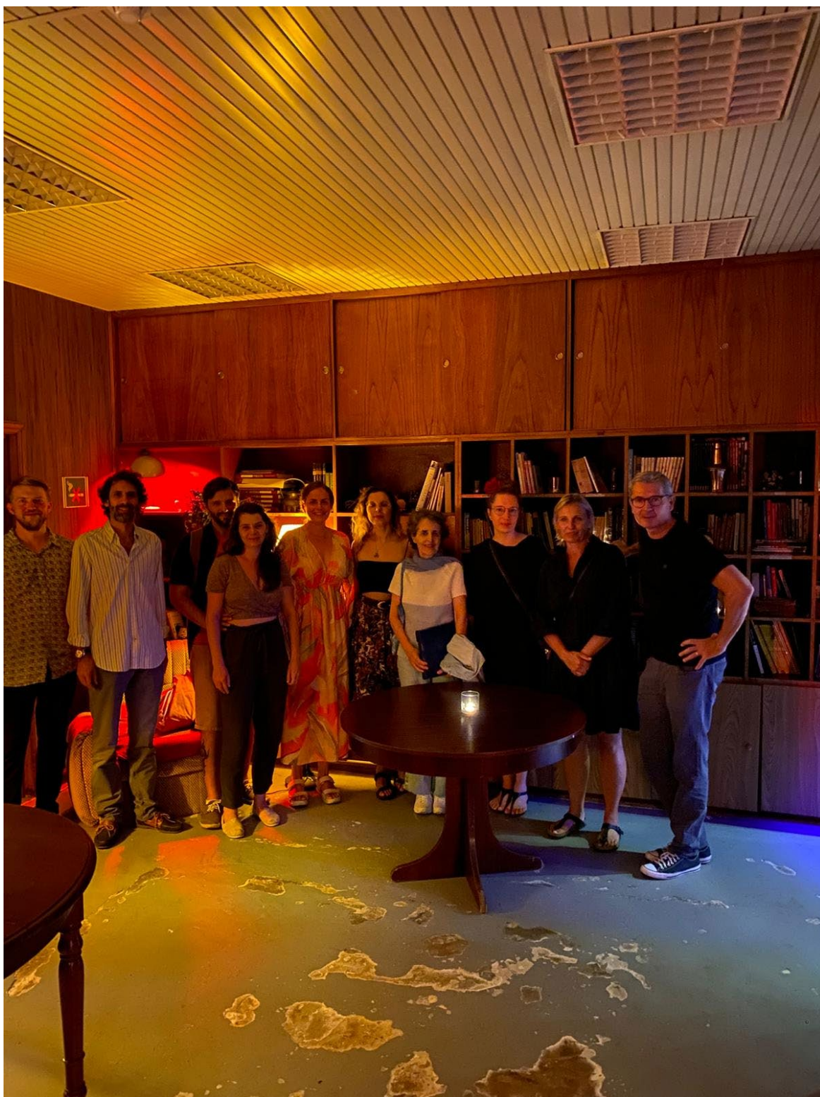
Společná fotografie se zpěvačkou Markétou Zdeňkovou