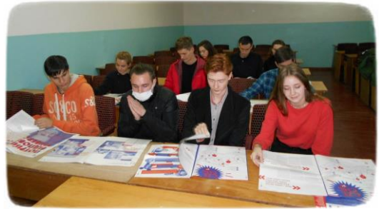
Žytomyrská státní polytechnická univerzita, výuka českého jazyka