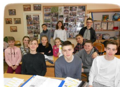
Češi Žytomyrské oblasti