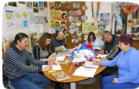
Žytomyrský spolek volyňských Čechů